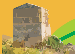
Torre de Gandul