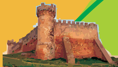
Castillo de Marchenilla