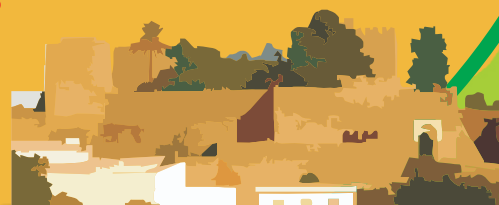
Castillo de Luna